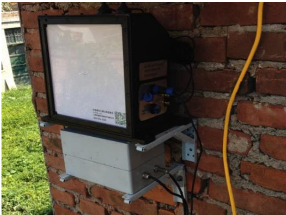
图 1 CCD 主机及电池安装

4. 安装电池：如图 1 所示将电池安装在 CCD 下方的电池安装支架上，并且用四颗自攻螺丝固定。