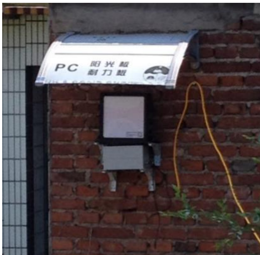
图 2 遮雨棚的安装