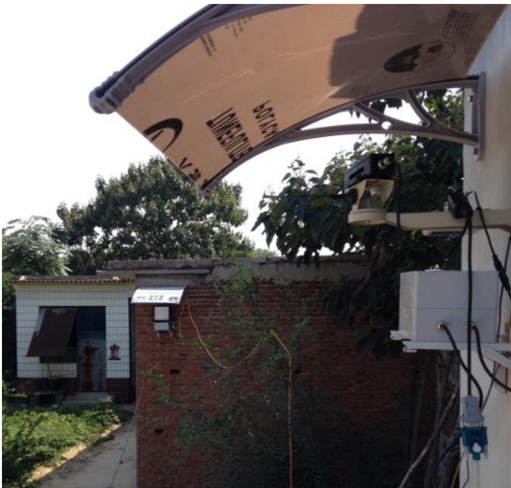
图 3 激光测距仪的安装